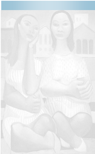
Di Cavalcanti, 1962.