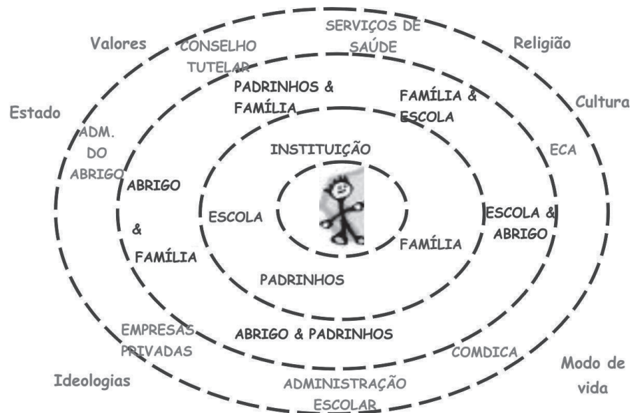
Figura 1. Mapa Ecológico da Criança e do Adolescente Institucionalizado (VASCONCELLOS, 2006)

Por outro lado, a entrada na instituição proporciona à criança um leque de relações novas, com atividades, papéis, funções e interações antes desconhecidas por ela. Nesse momento, o abrigo se torna o ambiente principal da vida da criança ou do adolescente. Yunes, Miranda e Cuello (2004) reiteram que a instituição passa a ser o microsistema central dos seus ambientes ecológicos. De acordo com Bronfenbrenner (1979/1996), o microsistema central pode ser definido como aquele contexto no qual a criança realiza as principais ações para seu desenvolvimento como um todo. Diante disso, a instituição assume um papel importante perante as relações interpessoais mais próximas que a criança desenvolve, tornando-se, assim, responsável pelas ações, experiências e aprendizagens. Essa interação da criança com o ambiente fica visível no diagrama do mapa ecológico, que é esboçado na Figura 1 sobre o modelo institucional: