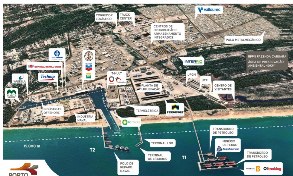
Figura 2 - Representação do Porto do Açu.

O Complexo Logístico e Industrial do Farol / Barra do Furado é um projeto constituído pelos municípios de Quissamã e Campos dos Goytacazes, com o apoio do Governo do Estado do Rio de Janeiro e do Governo Federal, e consiste na drenagem e preparo do Canal das Flechas com píer do Sandy By-Pass, sistema de transporte de areias projetado para evitar o assoreamento do Canal possibilitando a instalação de empresas do setor de Óleo e Gás. Os investimentos necessários para este projeto chegavam a R$ 1 bilhão